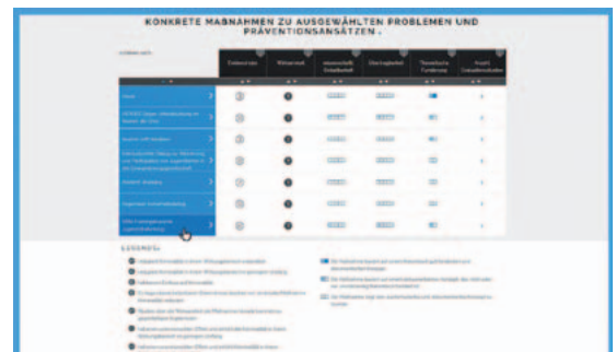
Abbildung 2: Ergebnisübersicht